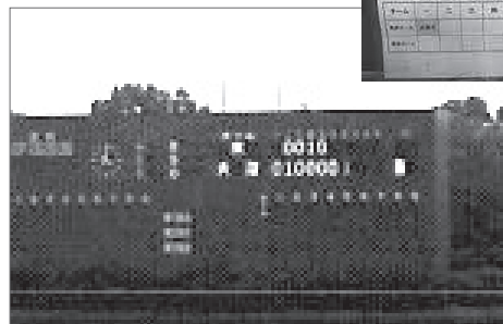
牛島球場のスコアボード